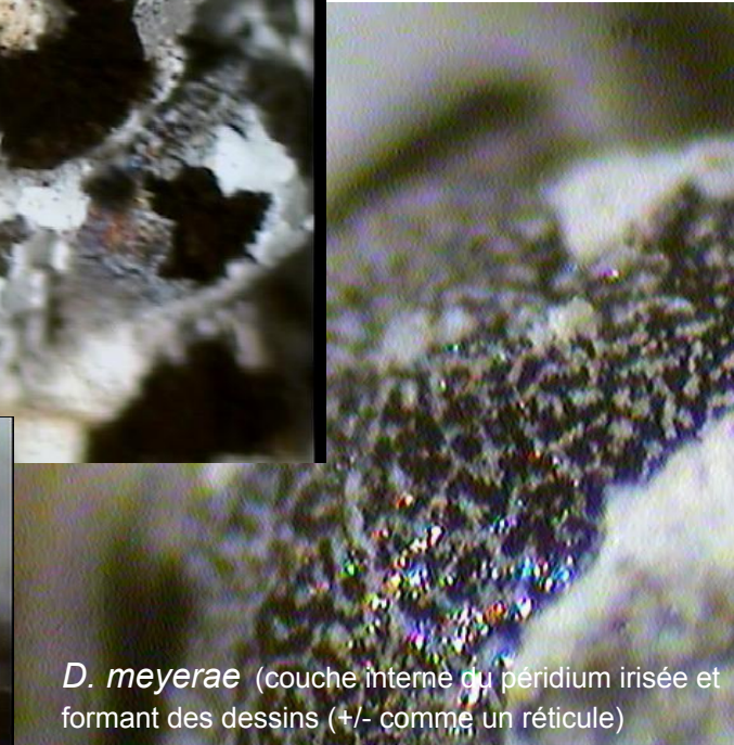
D. meyeræ (couche interne du périidium irisée et formant des dessins (+/- comme un réticule))