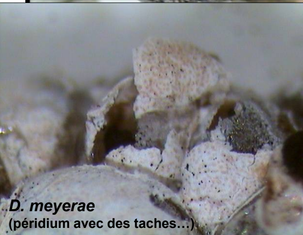
D. meyeræ (périidium avec des taches...)