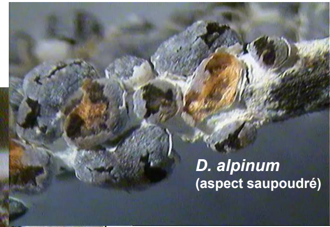
D. alpinum (aspect saupoudré)