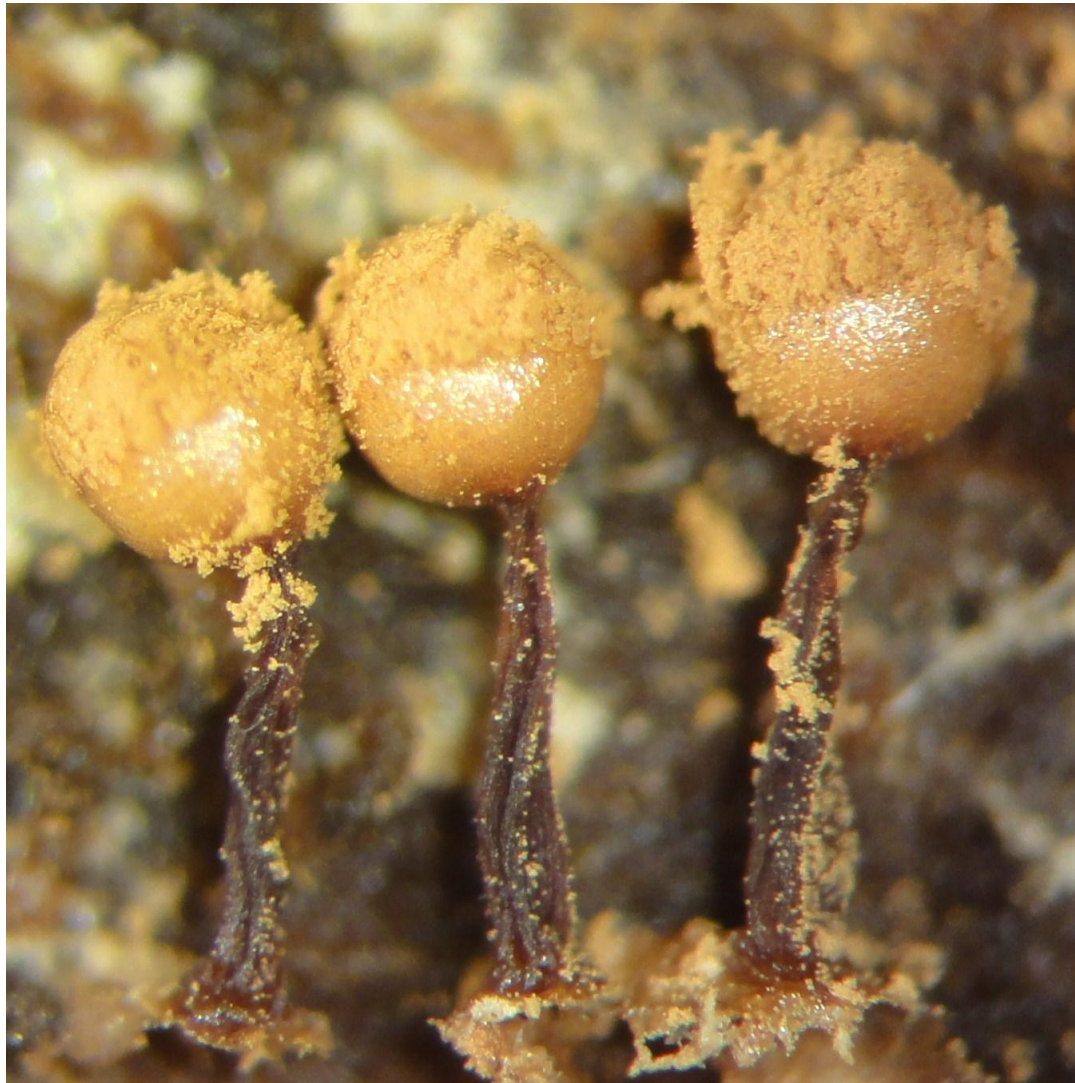
Sporocarpes de 1 à 2 mm de haut

16 octobre 2011 au Bois des Nonnes à Ittre-Fauquez, récolté par Luc sur du bois bien dégradé.