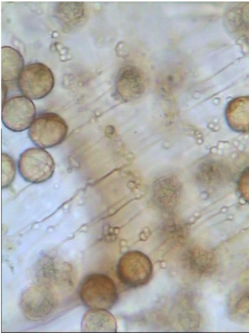
Cupule ridée longitudinalement